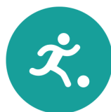
Spel en beweging/ bewegingsonderwijs